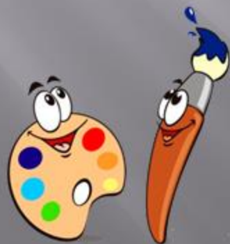
Натюрморт. Ефименко Григорий.